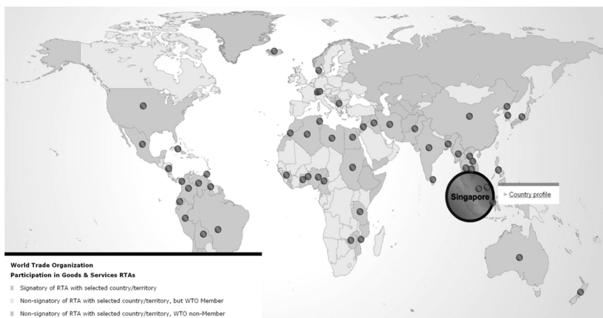
圖 2-1 新加坡簽署自由貿易協定對象國分佈概況

以新加坡為例，目前其簽署自由貿易協定之對象除亞洲、大洋洲等相對鄰近區域的貿易夥伴，更與歐洲、美洲與非洲等區域之貿易夥伴簽署自由貿易協定。該國以全球佈局之概念拓展其貿易網絡，且與其簽署自由貿易協定之非亞洲區域國家數共有 36 個（歐洲 5 個、美洲 15 個、非洲 14 個、大洋洲 2 個），而與其簽署自由貿易協定之亞洲國家數則為 20 個；若僅以其簽署涉及服務貿易之協定對象國所屬區域來看，仍涵蓋包括亞洲、大洋洲、歐洲與美洲等區域。新加坡目前簽署自由貿易協定對象國之分布情形，如圖 2-1。